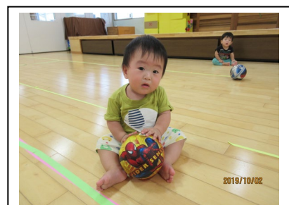
かがやきホールで遊んだよ

おやつ後20～30分位きらりチームとなごみチームの交流をしています。最初はうさぎ組が主でしたが、最近ではひよこ組も行きたい子は自ら相手チームの部屋へトコトコ行って、好きなあそびを楽しんでいますよ。