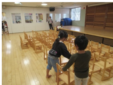
映画館ごっこ チケットはここです

0, 1歳児クラスやランチルームのお手伝い当番では、年下の子へいたわる気持ちが見られ、意欲的ががんばっています！