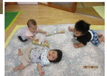
お布団の上はふかふかいい気持ち〜