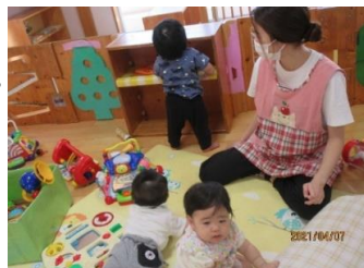
デコボコ登り降りも上手♪