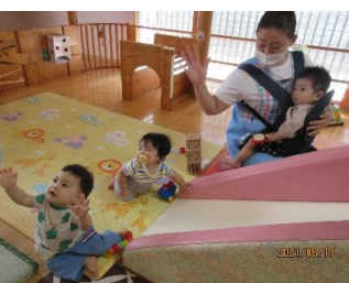
先生、ちょうだーい♪