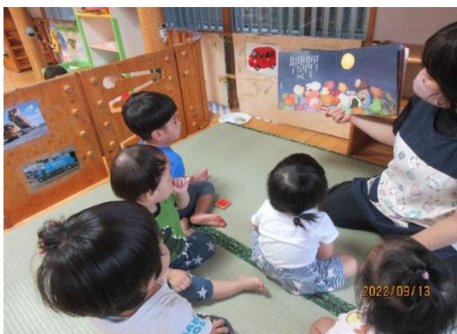
大好きな絵本を集中してみています！