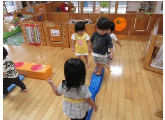
デコボコの橋渡り