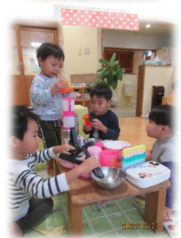
2022年最後は お掃除ごっこ！