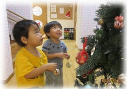
サンタさんからのプレゼントに大喜び！