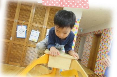
バランスボードに挑戦だ！ ドキドキするけどやってみよう。