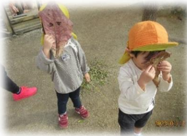
自然物は最高の遊び道具！