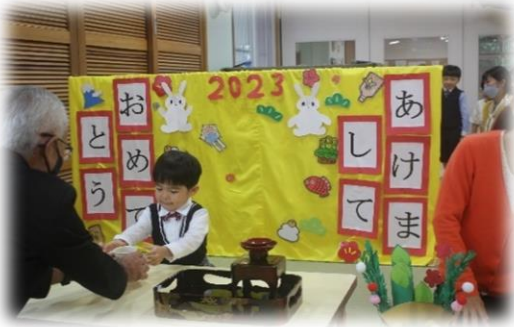
初めての新年会 「あけましておめでとうございます」の 挨拶もいえるかな？