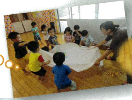
ボールを落とさないように頑張るぞ～！