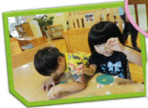
個性豊かなお面作り！！ 思い思いに製作を楽しんでいます♡