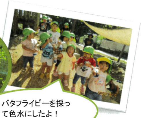
バタフライピーを採って色水にしたよ！