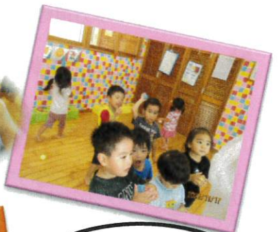
沢山の子ども達がロフトに登れるようになりました♪