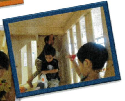
どこに貼ろうかな～♪