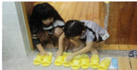
次のお友達が気持ちよくトイレに入ることができるよう♪