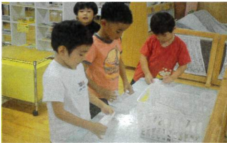
みんなでペーパーを畳んでくれています☆

らいおん組さんのお帰りのお集まりでは『今日1日の嬉しかったことニュース』の発表をしています。すると、「自分のことも発表して欲しい！」という思いから、トイレ用のペーパー畳みをしたり、トイレのスリッパを並べたり、コットやお布団を運んだりと積極的にお手伝いをしてくれるお友達が増えてとても助かっています♪