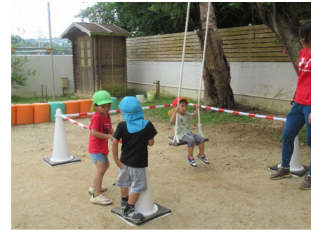
ブランコが設置されました。子ども達も大喜びです。