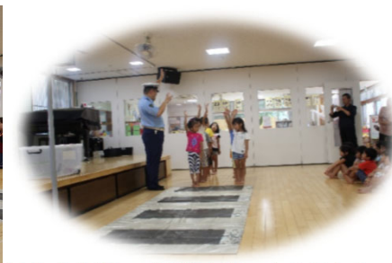
交通安全指導 横断歩道のわたり方を学びました