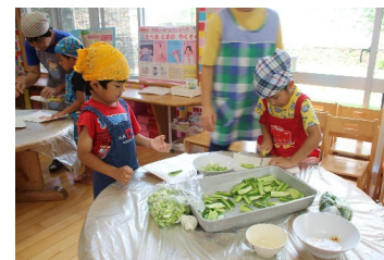
流しそうめん 具材を準備して