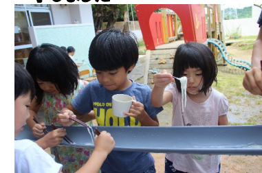
うまくとれるかなあ