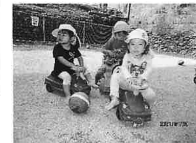
コンビカーに乗り「ゴーゴー！」