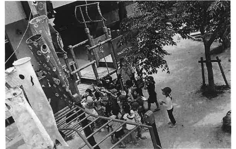
いるか組さんが作ったこいのぼりを掲揚しました。

昔から鯉は生命力が強く縁起のいい生き物として扱われてきました。他の魚と比べると、鯉はきれいな水の中のみならず、汚れた沼や池などでもしっかりと生きていける力を持っています。また中国では“鯉の滝登り”という言い伝えがあり、「鯉は激しく流れる滝を登り、龍になり天へ昇る」とされ、立身出世の象徴とされていたんです。五月人形は、戦国時代の武将がよろい兜を身に付けて自分の命を守ったことから、子どもを事故や災害から守るものとして飾られるようになりました。一つひとつに大事な意味が込められているのです。子ども達にもいろんな行事を通して意味や由来も伝えていきたいと思ひます。