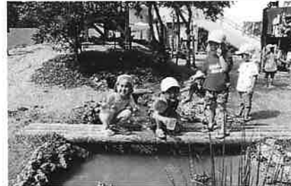
幼児用園庭にはビオトープや木のブランコもあります

園庭活動では、裸足からの刺激を大事にし裸足での園庭遊びを経験できるようにしています。裸足になって遊ぶことで土踏まずが形成され、足裏からの刺激により脳が活性化しバランス感覚が養われます。0・1歳児クラスは、慣れずに泣いてしまう子、足裏の感触に不思議がる子と様々な反応が見られます。2・3歳児クラスは、園庭でもおもしろい走り回ったり砂場でごっこ遊びを楽しんでいます。又、4・5歳児クラスからは、島ぞうりを用意してもらっています。ぞうりが脱げないように足指を使い、踏ん張る力も増え、足全体の筋力が強くなるためにバランス感覚も向上し、結果運動能力も向上していくのです。毎日、園庭に出て沢山体を動かし体力作りを行っていききたいと思ひます。